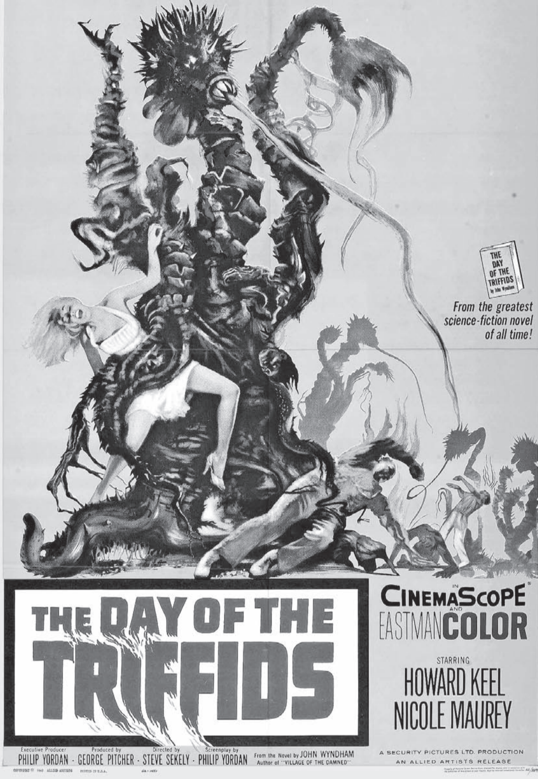
Nein, das ist nicht der «Triffids»-Gentechleinsamen: Plakat der ersten Verfilmung von John Wyndhams Roman, gedreht 1962. Die neuste filmische Adaption stammt aus dem Jahr 2009 und hat am 28. Dezember auf BBC Premiere.

BEWARE THE TRIFFIDS... they grow ...know...walk...talk...stalk...and KILL!